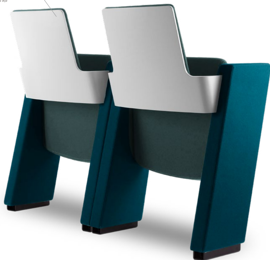
Retro schienale in legno laccato Lacquered wood backrest panel