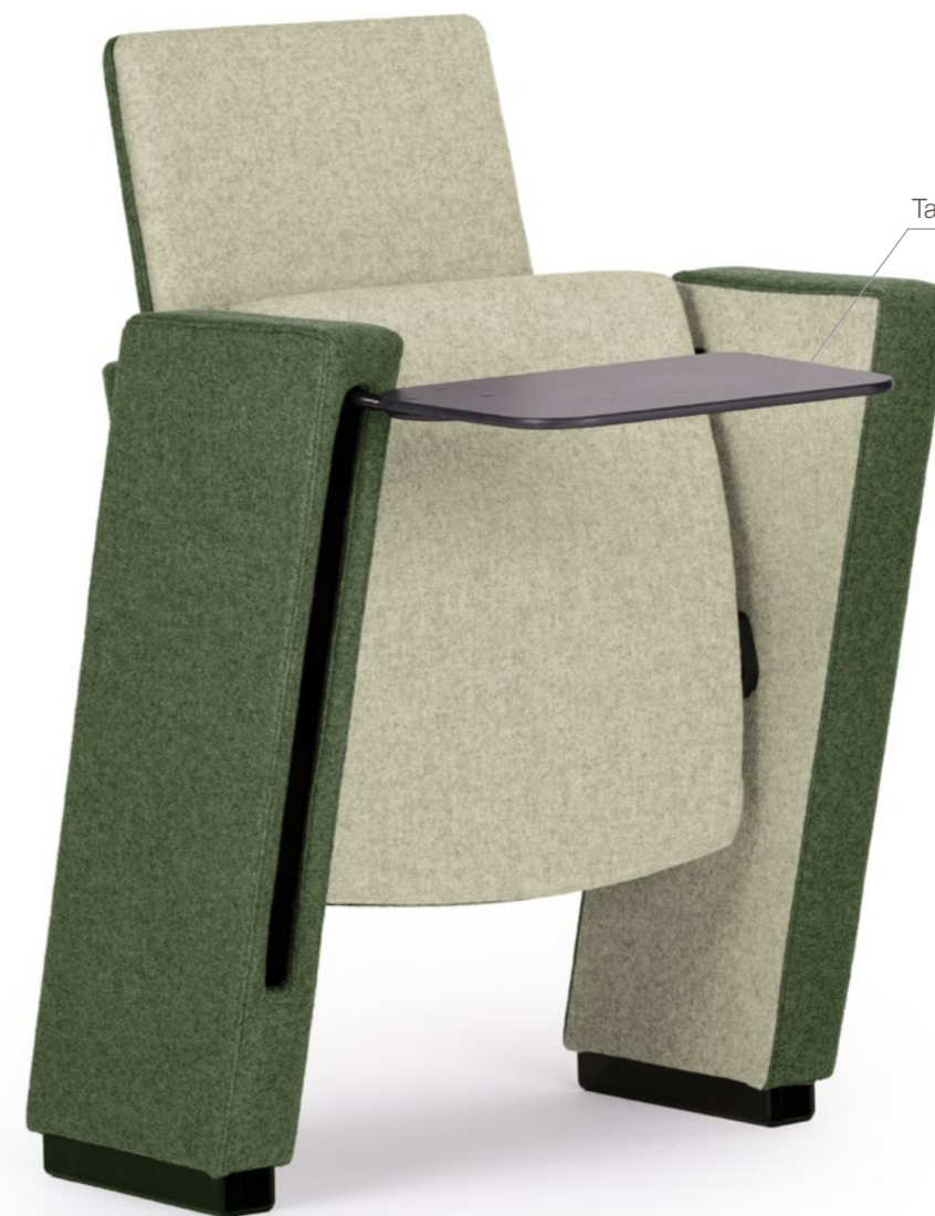
Tavoletta scrittoio a scomparsa Built in writing tablet