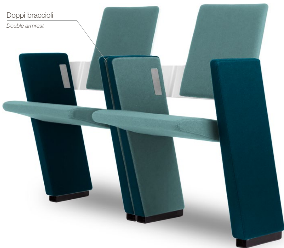
Doppi braccioli Double armrest